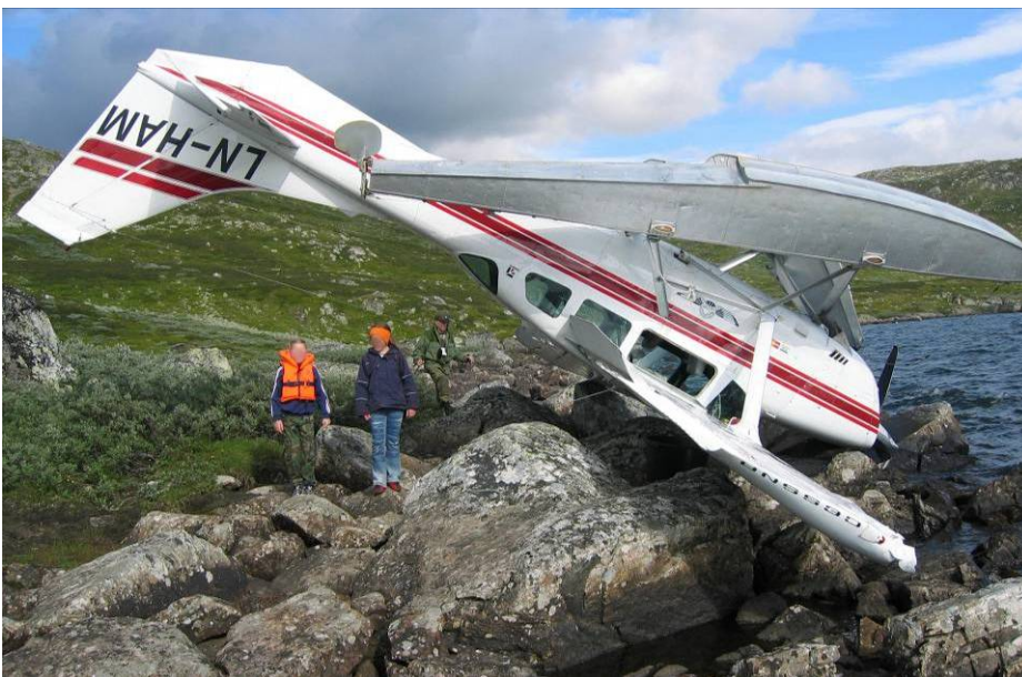
Figur 1: Flyvraket på havaristedet.

Fartøysjefen hadde ikke registrert noen tekniske uregelmessigheter med flyet før havariet.